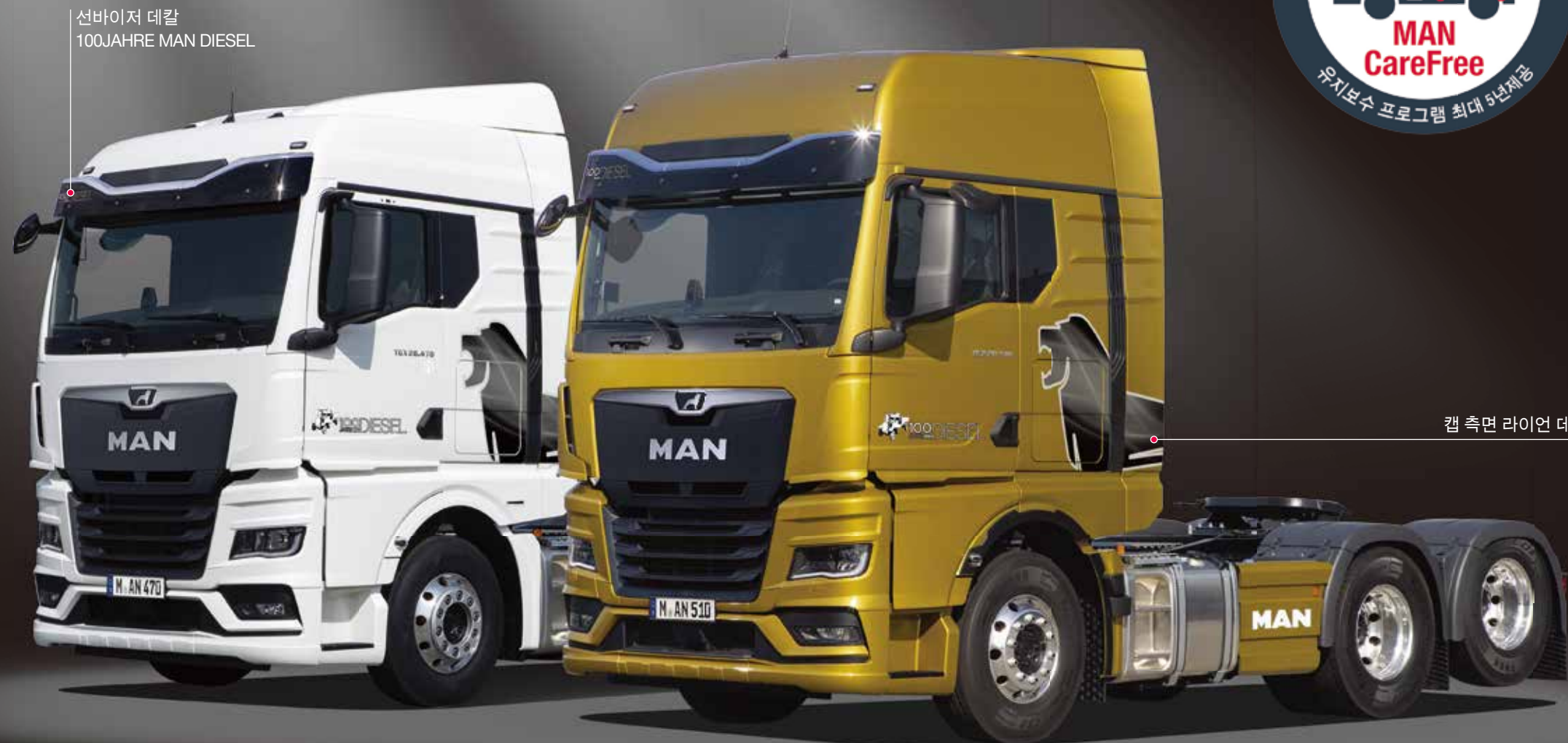
선바이저 데칼 100JAHRE MAN DIESEL